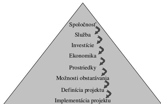
Obr. 1. Hierarchia a postup projektovania služieb. Fig. 1. Hierarchy and process of service projection.

Každé priemyselné odvetvie má niekoľko projektových oblastí, ktoré poskytujú niekoľko rôznych druhov služieb pre konkrétne aplikácie. Ich prehľad je popísaný hierarchiou a postupom projektovania služieb, ktorá je uvedená na obr. 1.